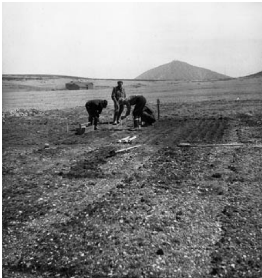
4. Stav školky na produkci sazenic kleče pro vysokohorské zalesňování v roce 1954. Kromě obdělávané půdy je patrná přechodná zóna s deponovanými kameny a drny.

Během 38 let přirozené sukcese se na bývalé obdělávané půdě vyvinul souvislý porost s převahou smilky. Pokryvnost smilky, tj. procento půdního povrchu pokrytého