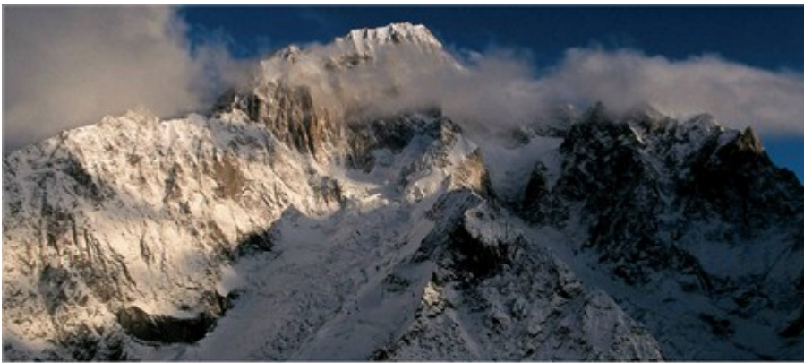
Alps mountains France, Switzerland Germany, Austria Italy, Spain Switzerland, Austria France